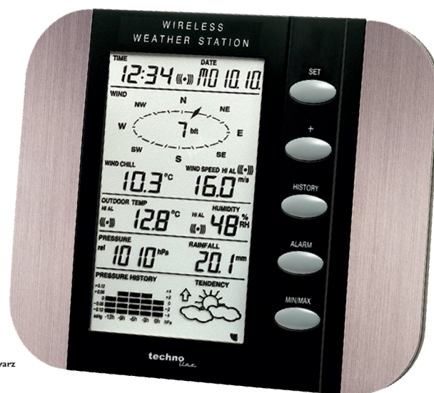
aluminium - schwarz